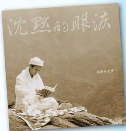
《沈默的眼淚》詩集 清海無上師寫於三十幾歲 福爾摩沙（台灣）1980年代

「我感受到人類為了要實踐不可能的事，所面臨的掙扎。我是說幾乎遙不可及的事，像是較高境界的開悟。我們都曾經歷過，無論你是聖者、罪人或凡人，如果你想找到真我，都會有那樣的掙扎。所以我感覺到人類的種種感受，這是發自內心的，我和全人類遭逢的痛苦掙扎是一體的。甚至連非修行者，他們也有失望和需要往內求助的時刻，去祈求冥冥不可知的力量，甚至去祈求他們不相信的上帝。在人的心中永遠存在著掙扎，所以我的詩集《沈默的眼淚》就是在反映那些。」