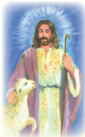
Chúa Giê-su Ki-tô