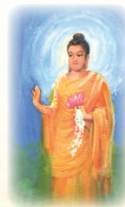
Phật Thích Ca Mâu Ni