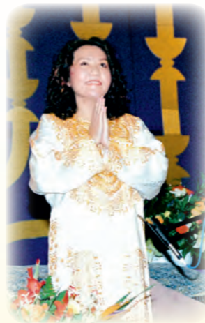
Thanh Hải Vô Thượng Sư