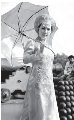
Chiến Tranh và Hòa Bình (Thông điệp hòa bình từ Thượng Đế trước pháo đài)