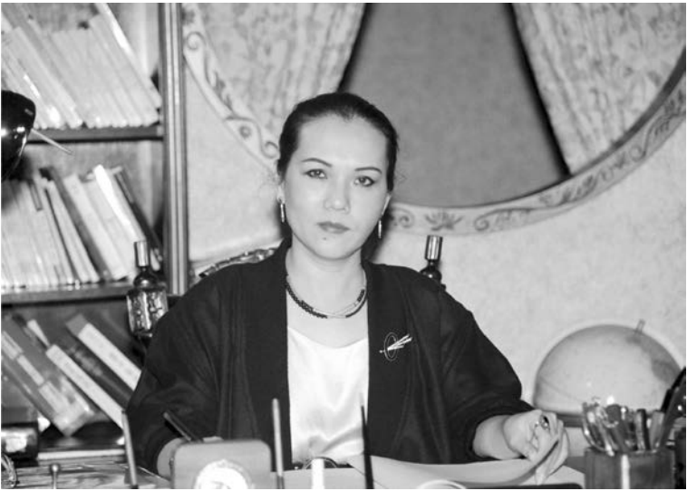
Thanh Hải Vô Thượng Sư