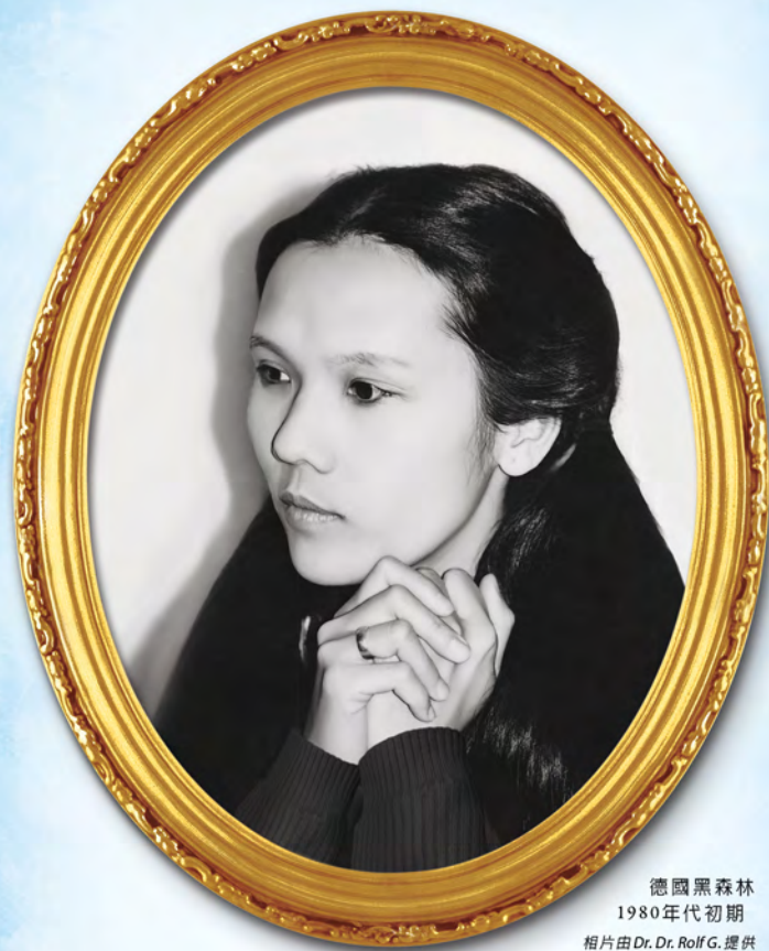
德國黑森林 1980年代初期