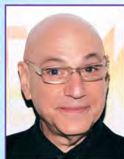
亨利·克列格 兩次葛萊美獎得主暨三次奧斯卡金像獎入圍者

道格·卡薩羅斯在許多百老匯和外百老匯劇作中擔任指揮、作曲、管弦配樂及編曲，如《渾身是勁》、《生活》、《洛基恐怖秀》、《聖壇男孩》、《毒魔復仇》、《我的名字叫愛麗絲》，和即將在百老匯上演的《似曾相識》。他為無數頂尖歌手，如法蘭克·辛納屈和葛洛麗雅·伊斯特芬等人打造過金唱片和白金唱片紀錄；也曾為《蝨子》、梅西百貨感恩節大遊行和美能品牌電視廣告譜曲。