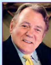
唐·皮蓬 東尼獎暨艾美獎得主

亨利·克列格從二十多歲時就開始為外外百老匯劇院(Off-Off Broadway)編寫作品，曾合作創造出長期上演的百老匯金牌音樂劇《夢幻女郎》，該經典曲目為他獲得一座葛萊美最佳原創專輯獎。在星光雲集的電影《夢幻女郎》中，克列格先生所創作的歌曲，為他再度獲得葛萊美獎，及三次奧斯卡金像獎提名。他的百老匯音樂劇《跳踢踏舞的孩子》和《附帶的演出》則獲東尼獎殊榮。《附帶的演出》亦獲東尼獎最佳作曲獎提名。