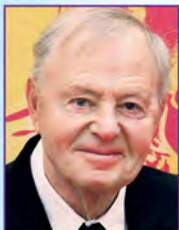
艾爾·卡夏 兩次奧斯卡金像獎得主

才華洋溢的喬治·卡拉卓利，在美國、拉丁美洲和歐洲都廣受歡迎，他在流行、爵士、拉丁、古典音樂領域的作品也備受讚譽。曾為芭芭拉·史翠珊、席琳·狄翁、珍妮佛·洛佩茲、史汀和東尼·班奈特等人擔任編曲、作曲和製作人。參與的電影作品包括《臥虎藏龍》（主題曲〈月光愛人〉獲奧斯卡提名）、《妙妙探》和《紫色姊妹花》。