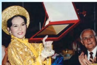
清海無上師榮獲「榮譽勳狀」。