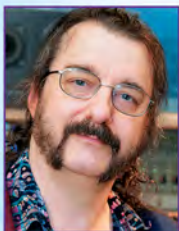
道格·卡薩羅斯 艾美獎得主

艾爾·卡夏在五十年音樂生涯中創作出許多暢銷唱片，從貓王艾維斯·普里斯萊到靈魂歌后艾瑞莎·弗蘭克林、海倫·瑞蒂和唐娜·桑默等藝人都演唱過他的作品。他獲得奧斯卡獎的歌曲有《海神號》中的〈清晨將至〉，以及《火燒摩天樓》中的〈我們無法再如此相愛〉。卡夏先生還為《天堂狗歷險記》和《巨龍家族》等電影配樂。在百老匯方面，他創作的《七對佳偶》和《塊肉餘生記》榮獲了東尼獎最佳原創作曲獎提名。