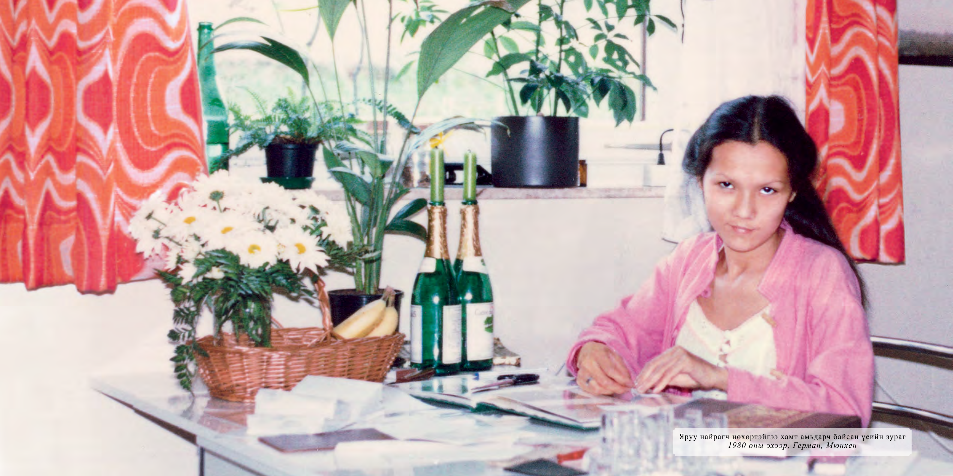
Яруу найрагч нөхөртэйгээ хамт амьдарч байсан үеийн зураг 1980 оны эхээр, Герман, Мюнхен