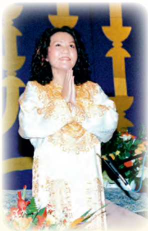
La Maestra Suprema Ching Hai